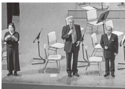
本公演前のご挨拶