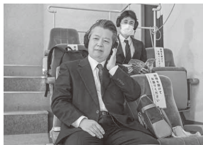
ボディソニック席