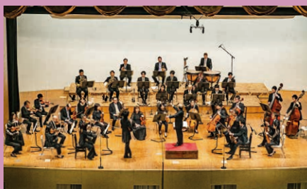
本公演 ベートーヴェン ヴァイオリン協奏曲