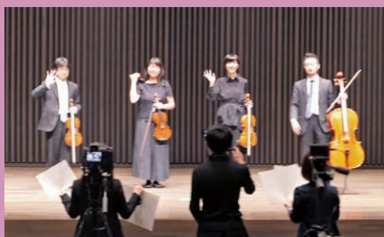
ふれあいコンサート収録(杉並公会堂)