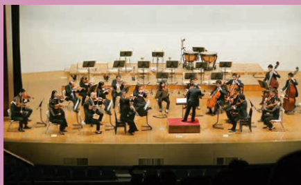
本公演 モーツァルト ディヴェルティメント