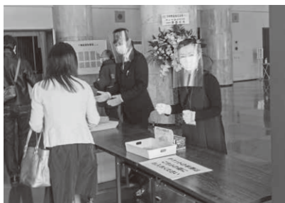
もぎり・プログラムのご案内