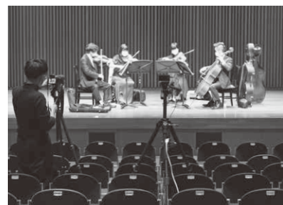
ふれあいコンサート収録(杉並公会堂)