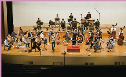
リハーサル兼ゲネプロ 本公演前日