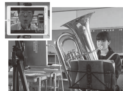
音楽クリニック リモートレッスン