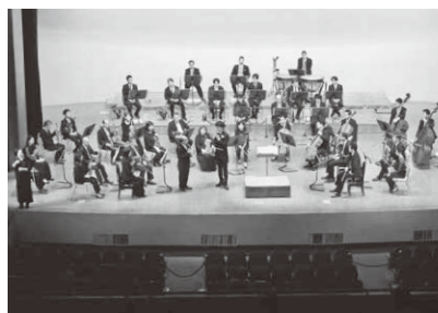
本公演 ベートーヴェン ヴァイオリン協奏曲