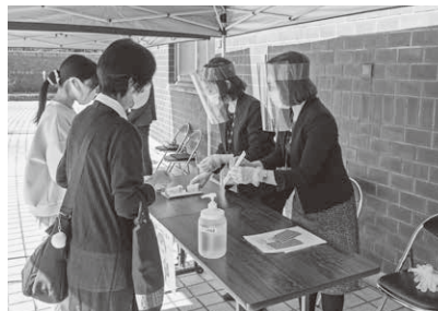
検温、チケット確認の受付