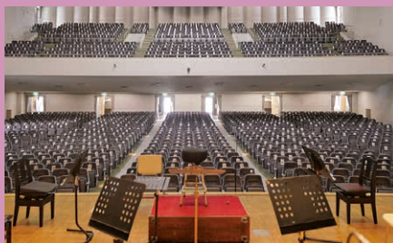
着席できない席に分かりやすくご案内書を