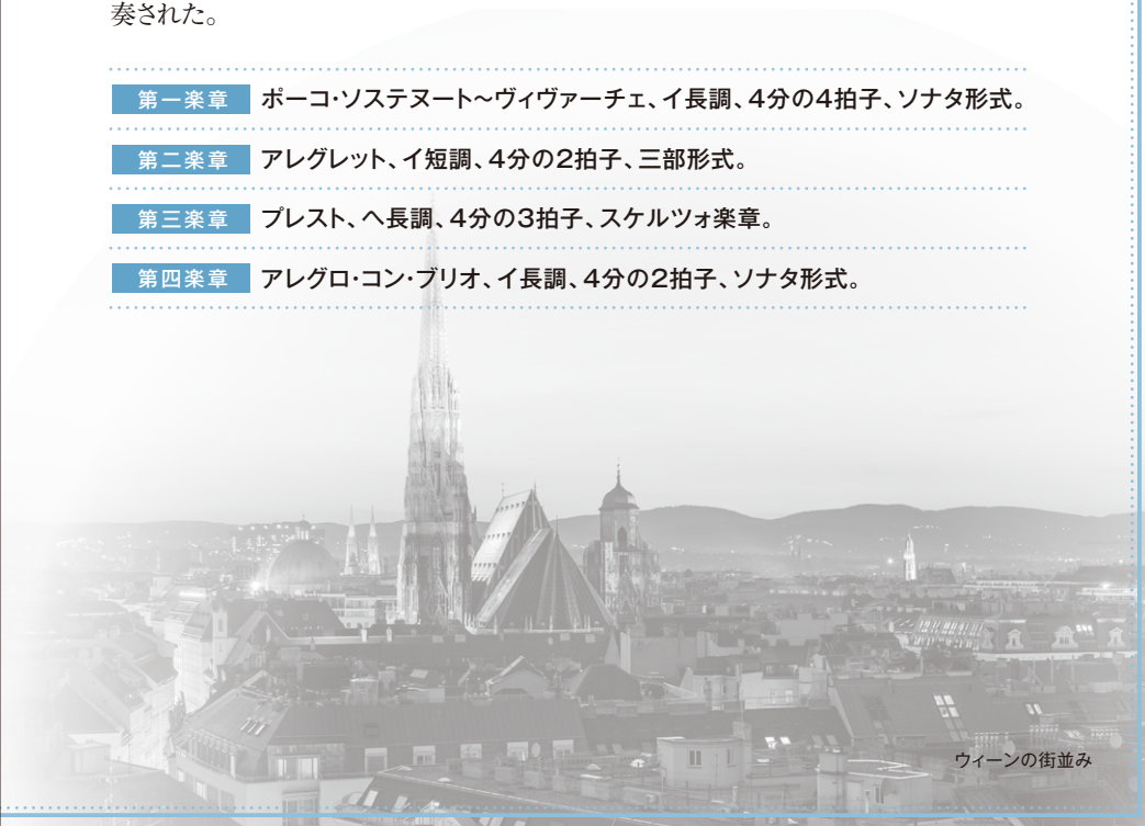
ウィーンの街並み